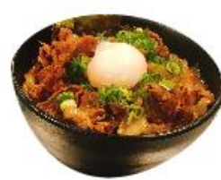
スタミナ井 ¥680 肉 2倍 ¥930