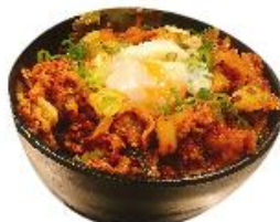
豚キムチ井 ¥780 肉 2倍 ¥1399