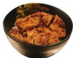
牛スジカルビ井 ¥801 肉 2倍 ¥1504