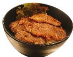
特製井 ¥1100 肉 2倍 ¥2040