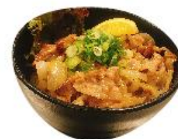
ネギ塩豚カルビ井 ¥680 肉 2倍 ¥1299